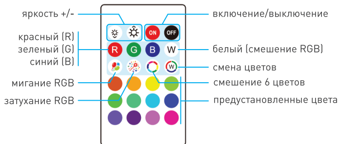
Рисунок 2. Назначение кнопок на пульте SMART-MINI-RGB-SET